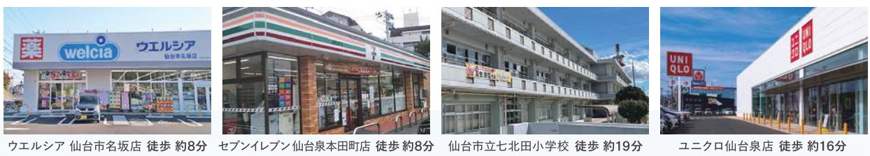
ウエルシア 仙台市名坂店 徒歩 約8分 セブンイレブン 仙台泉本町店 徒歩 約8分 仙台市立七北田小学校 徒歩 約19分 ユニクロ 仙台泉店 徒歩 約16分

日常のお買い物は、 ヨークベニマルのある 大型商業施設 「ヨークタウン市名坂」で