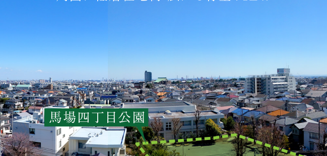
7階相当の眺望写真 (2024年4月撮影)