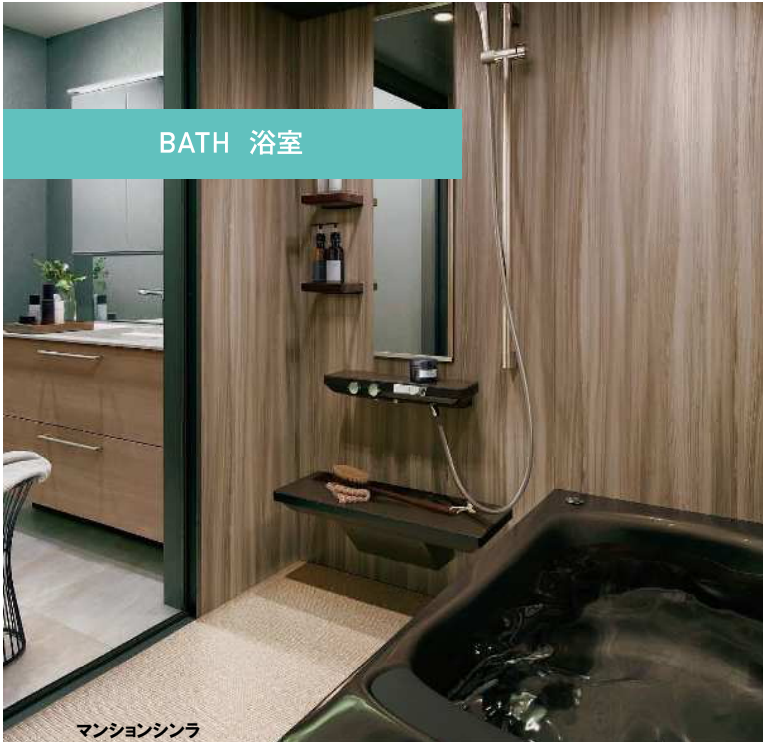
マンションシンラ